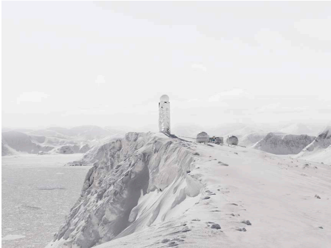
North Warning System