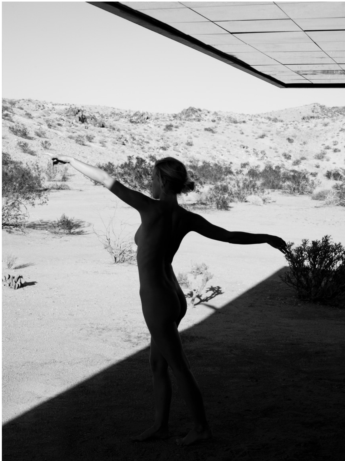
She Disappeared into Complete Silence © Mona Kuhn AD 7085, 2014