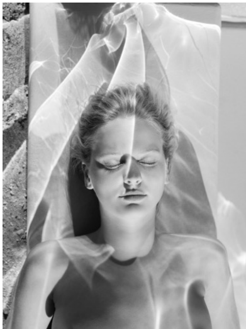
She Disappeared into Complete Silence © Mona Kuhn AD 7809, 2014

(Text: A. Meyer / Clervaux - cité de l'image)