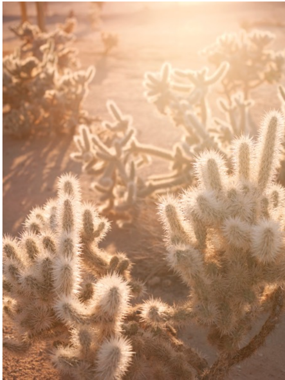
She Disappeared into Complete Silence © Mona Kuhn AD 6705, 2014