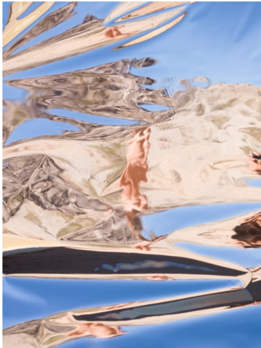
She Disappeared into Complete Silence © Mona Kuhn AD 7573, 2014

(Texte : A. Meyer / Clervaux - cité de l'image)